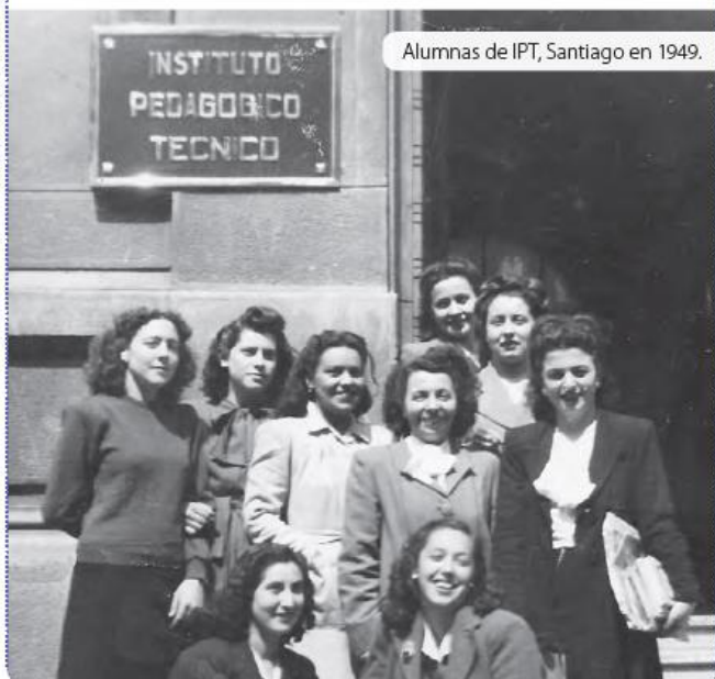
Alumnas de IPT, Santiago en 1949.

En la fotografía se observa a un grupo de estudiantes en la entrada del Instituto Pedagógico Técnico. Este instituto fue creado en 1944 con la misión de formar profesores para la enseñanza técnica. Durante este período el acceso de las mujeres a la educación aumentó enormemente.